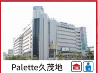
Palette久茂地 那霸市歷史博物館位於該大樓的四樓