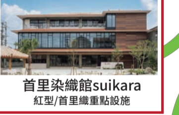
首里染織館suikara 紅型/首里織重點設施