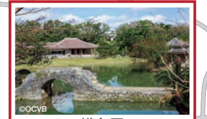
識名園 琉球王家最大的別墅