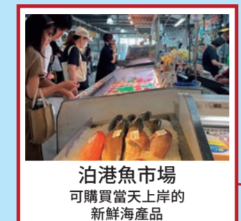
泊港魚市場 可購買當天上岸的新鮮海產品