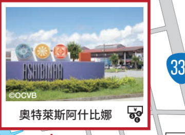
奧特萊斯阿什比娜